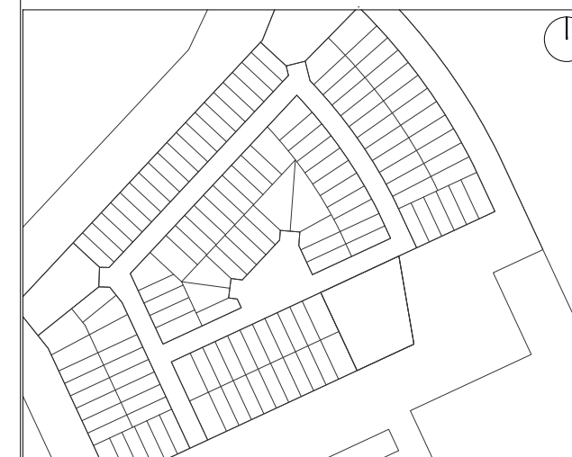
ADOSADA SECTOR MÓSTOLES SUR